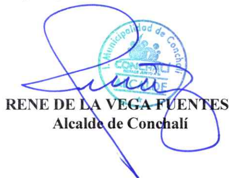
RENE DE LA VEGA FUENTES Alcalde de Conchalí