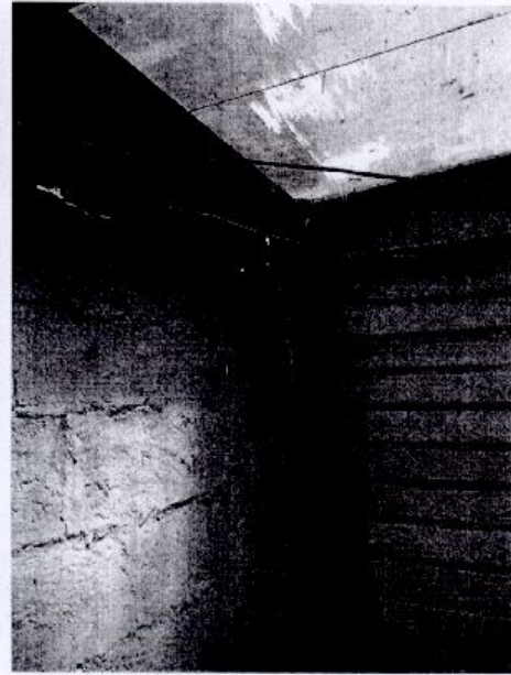
COBERTIZO PATIO TRASERO