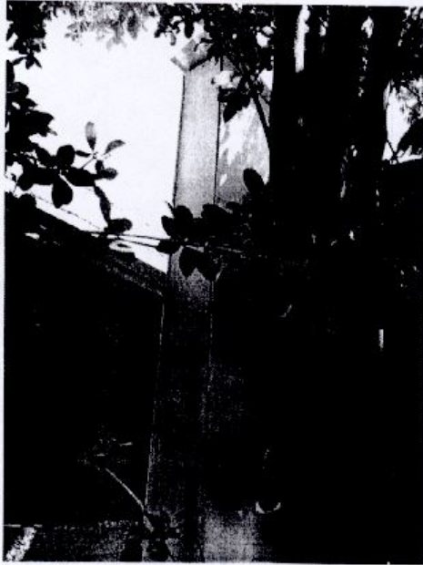
DETALLE DE CORTAFUEGOS IMPLEMENTADO