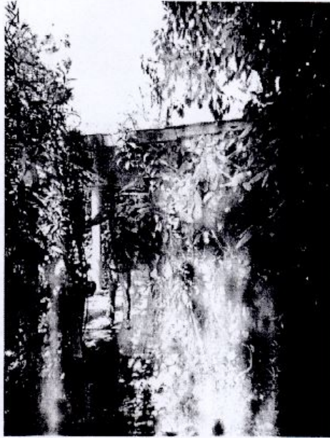
TOMA DE VOLUMETRIA BODEGA