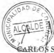
CARLOS SOTTOLICHIO URQUIZA Alcalde de Conchalí