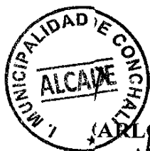
CARLOS SOTTOLICHIO URQUIA ALCALDE DE CONCHALI