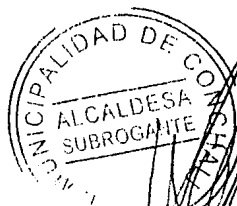
ADELA FUENTEALBA LABBE Abogada Alcaldesa de Conchalí (S)