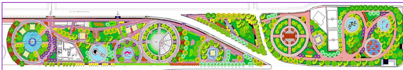
Imagen referencial del proyecto “Mejoramiento Parque Las Américas”

Otro de los proyectos relevantes en esta categoría es el “Mejoramiento del Parque Las Américas” que se reevalúa actualmente, considerando los criterios de sostenibilidad en eficiencia hídrica y energética, además del tipo de intervención en paisajismo a lo largo del parque. La intervención considera paseos peatonales, espacios de áreas verdes, oficina de administración, nuevas luminarias Led, una zona de deportes y juegos, un juego de agua en una superficie de 44.598 m 2 . Durante el año 2022, se ha trabajado en la elaboración de los antecedentes técnicos para su recomendación favorable RS por parte del MDSF (ex MIDESO).