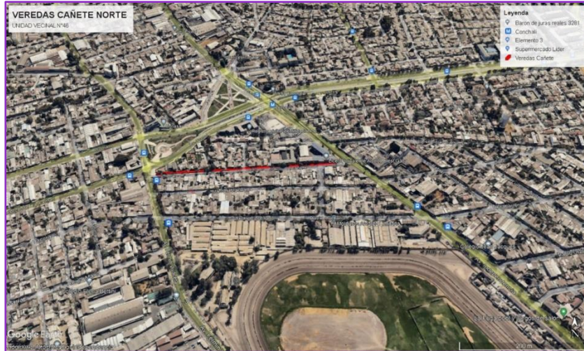
"Reposición Veredas Cañete Norte"

Reposición de Veredas en Catalina U.V N° 13. Iniciativa que contempla el mejoramiento de 912 metros cuadrados de veredas en la unidad vecinal N°13 de la comuna en la calle Catalina, para lo cual se demolerán las veredas existentes y después se dispondrá una base estabilizada junto a la estructura de hormigón, con sus respectivos dispositivos de rodado que corresponden a la accesibilidad universal. Actualmente, la iniciativa se encuentra en fase de resolución de observaciones.